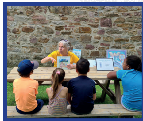
Musée régional de Vaudreuil-Soulanges

Horaire et lieu disponible au kiosque de Cyprienne