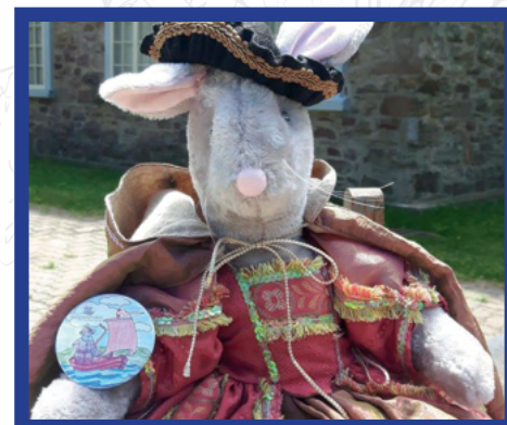
Musée régional de Vaudreuil-Soulanges

Les aventures de Cyprienne ainsi que le tome hors-série Les Seigneuriales y seront présentés. Ces 12 tomes éducatifs et ludiques, produits par le Musée régional de Vaudreuil-Soulanges, sont écrits par Chantal Séguin et illustrés par Johanne Mitchell.