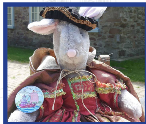
Musée régional de Vaudreuil-Soulanges

Les aventures de Cyprienne ainsi que le tome hors-série Les Seigneuriales y seront présentés. Ces 12 tomes éducatifs et ludiques, produits par le Musée régional de Vaudreuil-Soulanges, sont écrits par Chantal Séguin et illustrés par Johanne Mitchell.