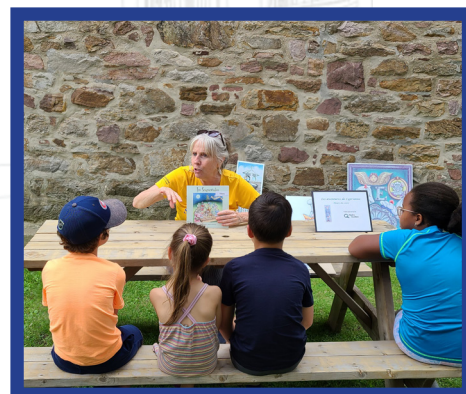
Musée régional de Vaudreuil-Soulanges

Horaire et lieu disponible au kiosque de Cyprienne